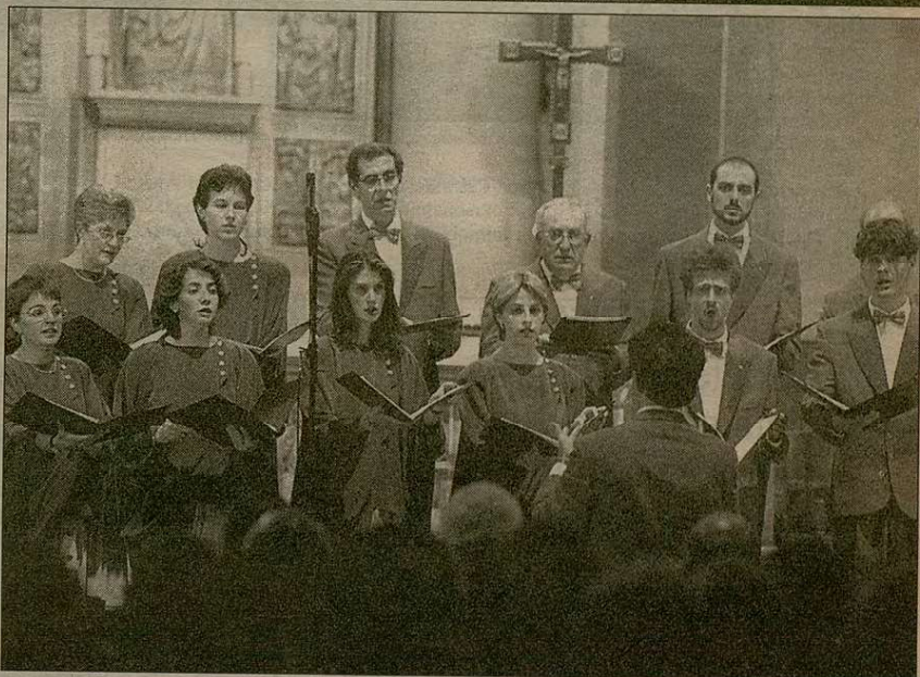
Els membres de la Coral Sant Jordi, en la seva actuació a l'església de Sant Pere.

concert al Palau de la Música Catalana, amb l'Orquestra Simfònica de Barcelona i nacional de Catalunya, els dies 19, 20 i 21 de desembre. L'obra inter-