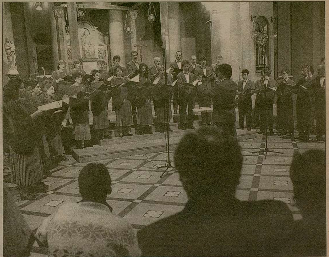
La Coral Sant Jordi va actuar diumenge a l'església de Sant Pere, que es va omplir de gom a gom.